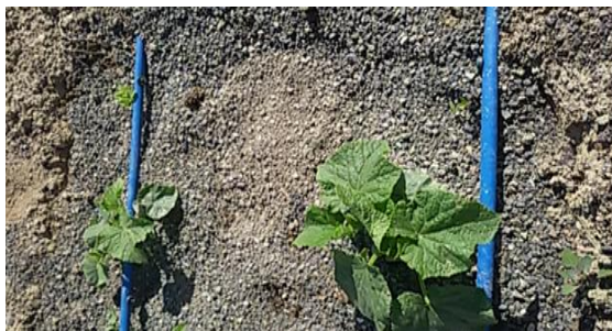
شکل ۱- مالچ‌دهی سنگریزه و اجرای آبیاری قطره‌ای در کرت‌ها